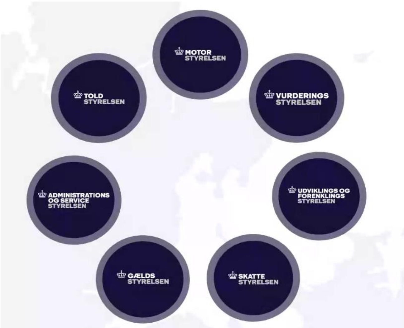
Figur: Opdelingen af Skat i 7 nye styrelser. 13

Tankegangen bag denne decentralisering af skatteforvaltningen synes at være, at man hermed vil bringe skat som organisation og ledelsen tættere på kerneopgaverne: "Vi skal have fagligt stærke styrelser, som er tæt på kerneopgaverne...". 14