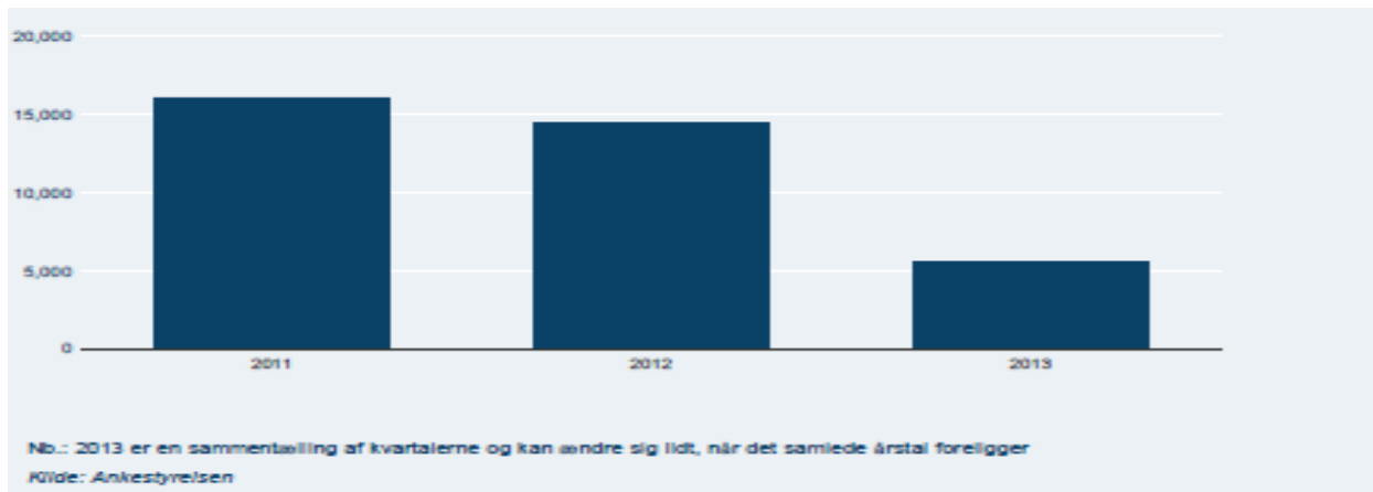
Figur: Antal årlige nytilkendelser af førtidspension 2011 -2013. 2

Antallet af borgere på førtidspension er faldet med 19.197 fra november 2011 til november 2014, mens op mod 8.000 ressourceforløb blevet iværksat. 3