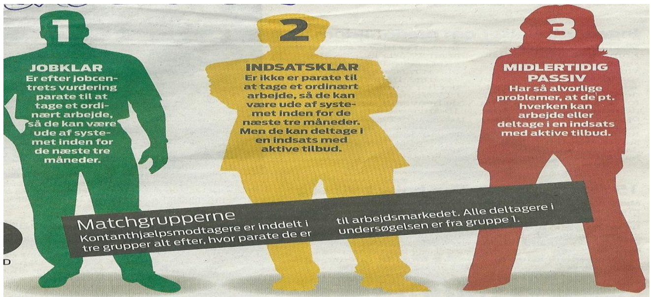
Figur: Matchkategorier for kontanthjælpsmodtagere. 8

De som er tilbage i laveste matchkategorier ER derfor de, som ikke er i nærheden af arbejdsmarkedet på grund af andre problemer: Sociale, psykiske, misbrug eller for den sags skyld etniske.