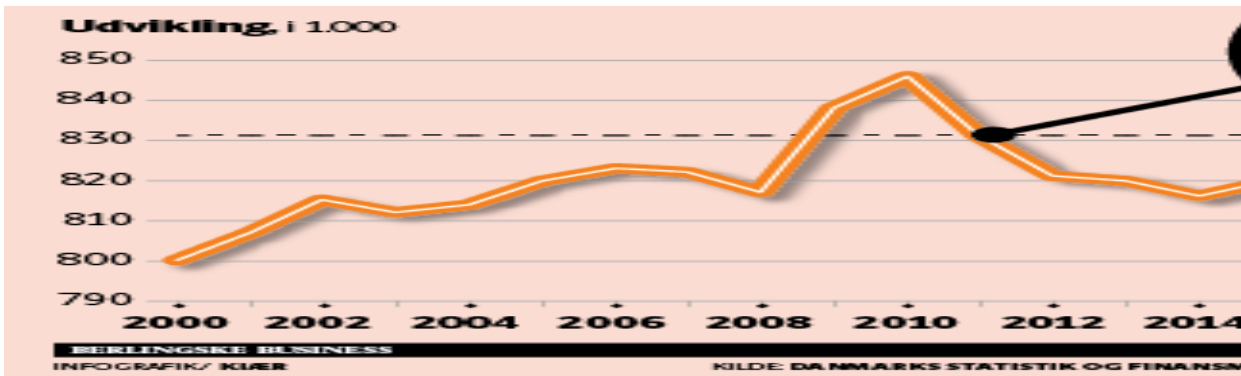
Figur: offentlig beskæftigelse 2000 – 2020. 21

Alene besparelserne som følge af det nye omprioriteringsbidrag vil medføre, at den kommunale beskæftigelse i de kommende år frem til 2019 vil blive reduceret yderligere med mellem 9 og 11.000 i forhold til det planlagte i Konvergensprogram 2015. 22