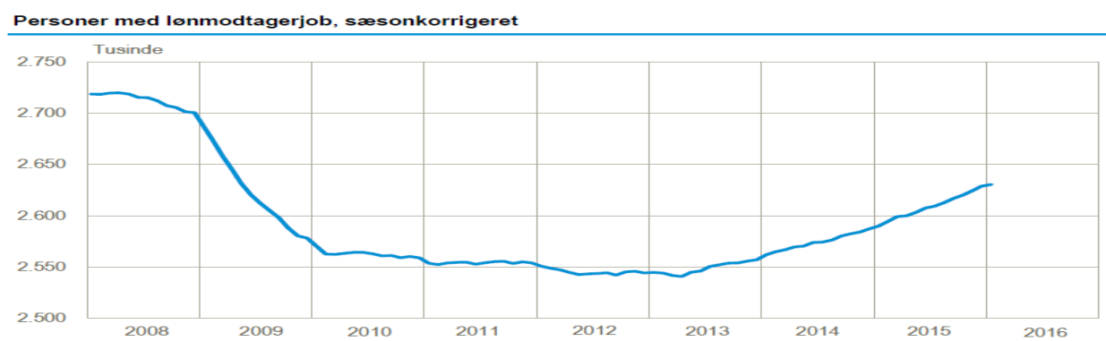
Figur: Beskæftigelse for lønmodtagere 2008 - 2015. 27

Selvom beskæftigelsen fra 2014 og frem til i dag er vokset noget, er der stadig et betragteligt efterspørgselsunderskud efter arbejdskraft på omkring 100.000 blot for at genvinde beskæftigelsesniveauet fra før finanskrisen. Vi er altså stadig i den fase, hvor der stadig ikke er fundet beskæftigelse til finanskrisens ledige og der er meget langt dertil, hvor man kan begynde at tale om efterspørgsel efter de ekstra arbejdssøgende som "Dagpengereformen" og andre reformer sender yderligere ud i jobsøgningskøerne.